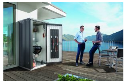
Geräteschrank Gerätehalter und Regalböden, feuerverzinktes, einbrennlackiertes Stahlblech, Schraubverbindungen, Edelstahlscharniere und -beschläge,

Wenn auch Grill, Rasenmäher, Schaufel, Harke & Co. Platz finden sollen, macht als nächstgrößere Variante ein Geräteschrank aus Stahlblech Sinn. Diese bieten je nach Ausführung auch für Fahrräder Platz. Manche Hersteller, wie beispielsweise die Firma biohort, haben zusätzlich Regale im Angebot, sodass man sich sein Ordnungssystem individuell gestalten kann.